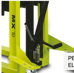
PEDAL PARA ELEVACIÓN