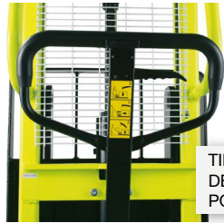
TIMÓN Y PALANCA DE CONTROL CON 3 POSICIONES