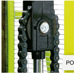
POLEA DE ACERO