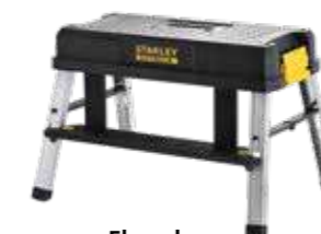
Elevador 150kg de capacidad máxima