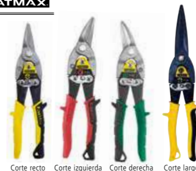
Corte recto Corte izquierda Corte derecha Corte largo