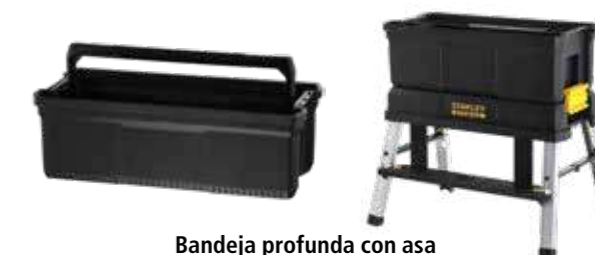
Bandeja profunda con asa Cierres laterales para asegurar al elevador