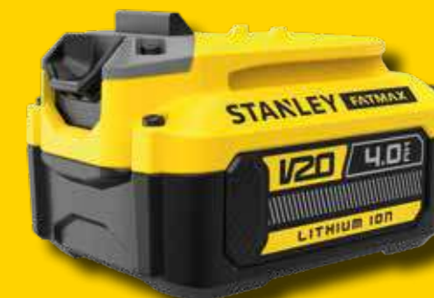
Batería V20 de 4Ah, valorada en 79€

POR LA COMPRA DE UNA HERRAMIENTA ELÉCTRICA O JARDÍN V20