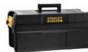
Caja 25" IP54 y asa ergonómica