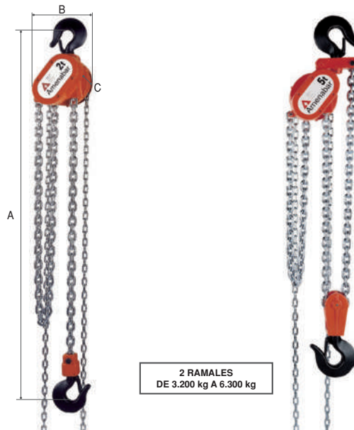
1 RAMAL DE 250 kg A 2.000 kg