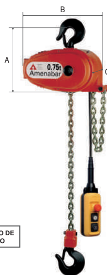
POLIPASTO DE GANCHO