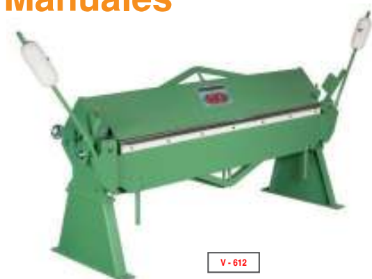
V - 612