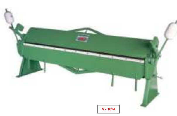
V - 1014