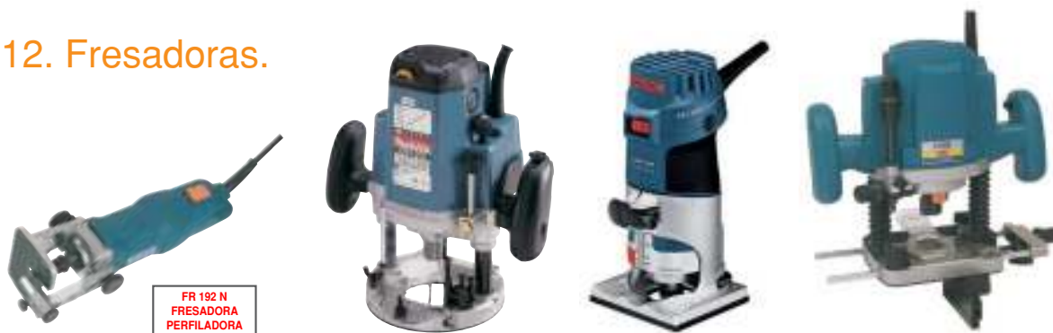
FR 192 N FRESADORA PERFILADORA